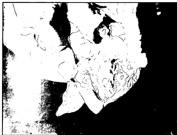
تصویر ۱ - نقاط سفید در داخل بطن چپ و خارج میوکارد.

ولی بیشترین کمبود در ناحیه ارومیه قابل رؤیت بود.