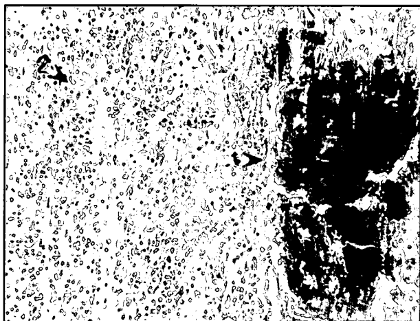
تصویر ۲ - کلسیفکاسیون شدید و جایگزینی بافت فیبروز. ۱- کلسیفکاسیون شدید در میوکارد (ناحیه نکروتیک)، ۲. تهاجم شدید سلولهای آماسی و جایگزینی بافت فیبروز (اسکارتیوشو).