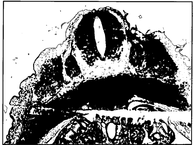
تصویر ۱- عکس میکروسکوپی از مقطع عرضی بخش پشتی در ماه دوم از دوره رشد جنینی. مقطع عرضی لوله عصبی و ستیغهای عصبی در قسمت‌های جانبی آن مشاهده می گردد. سومیت ها در کنار ستیغهای عصبی در حال تمایز بوده و در این مرحله اپیدرم که از اکتودرم حاصل می شود بسیار نازک می باشد. بافت مزانشیمی زیر اپیدرم از سومیت ها بوجود می آید. (رنگ آمیزی H&E، بزرگنمایی ۴۰×)