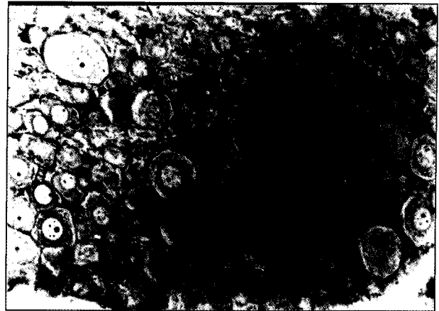
تصویر ۱- منظره‌ای از نورونهای گانگلیون سمت راست (آکسوتومی نشده) در گروهی که با ۲۵ میلی‌گرم در کیلوگرم دپرنیل تحت درمان قرار گرفته است. (به هسته‌های روشن حاوی هستک و ابعاد نورونها توجه شود. H&E و بزرگنمایی: ۲۰۰).

بافت شناسی دانشگاههای ارومیه و تربیت مدرس که در انجام این پژوهش نقش سازنده‌ای را ایفاء نموده‌اند، صمیمانه تشکر و قدردانی می‌گردد.