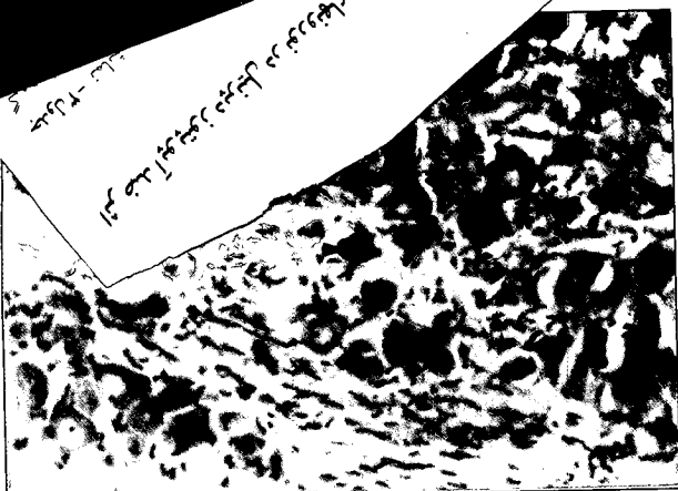
تصویر ۲- تصویری از نورونهای آپوپتوتیک گانگلیون سمت چپ (آکسوتومی شده) در گروه کنترل. به نورونهای چروک خورده و فشرده شدن کروماتین در یکطرف هسته (پیکان ضخیم) و اجسام آپوپتوتیک (پیکان نازک) و نیز ابعاد نورونها، توجه شود. H&E و بزرگمایی: ۲۰۰.