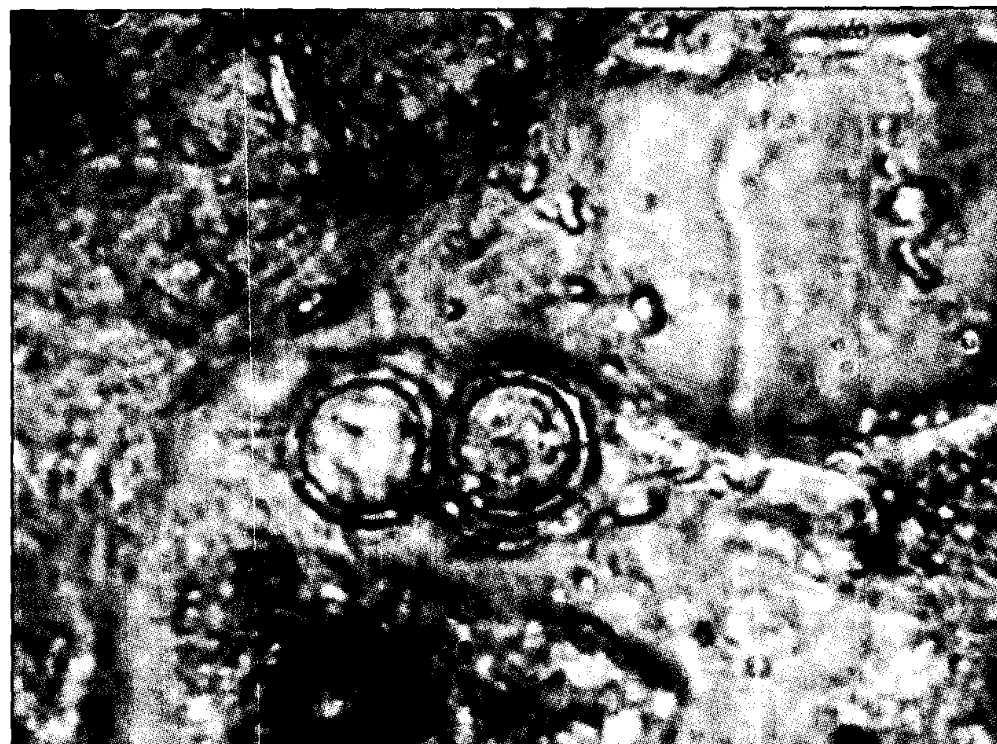
تصویر ۱ - حلقه‌های ایجاد شده توسط هایف قارچ آرترو بوتریس پس از عبور از دستگاه گوارش در مدفوع گوسفند (عدسی شیئی ۱۰).

تمامی ساختمانهای قارچی شامل کنیدیوم‌ها، تله‌های ایجاد شده و همچنین نوزادان مرحله سوم به دام افتاده رویت گردید. لازم بذکر است که نتایج به دست آمده توسط هر دو روش توده مدفوع و کشت مدفوع کاملاً با یکدیگر همخوانی داشتند.