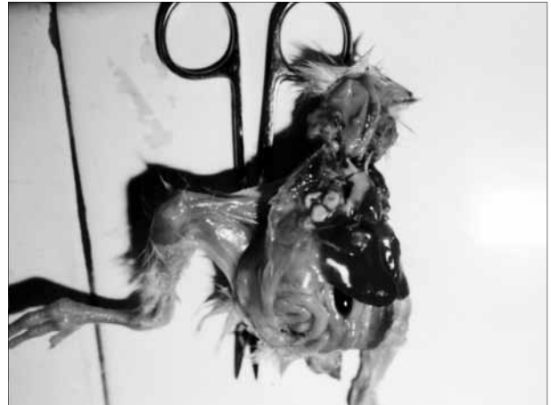
تصویر ۱- ریه مبتلا به آسپرژیلوزیس، ندول های درشت سطحی به خوبی نمایان می باشد.

درصد) بوده است. در قناری علاوه بر آسپرژیلوزیس ریوی، ۳ مورد آسپرژیلوزیس چشمی نیز دیده شد و در کبوتر نیز آسپرژیلوز چشمی (۱ مورد) و پوستی (۱ مورد) نیز دیده شده است. در حالی که در سایر پرندگان تنها آسپرژیلوزیس ریوی مشاهده گردید (تصاویر ۵-۱).