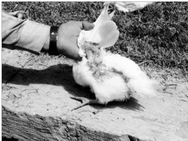
تصویر ۵- آسپرژیلوزیس جلدی در طیور، در قسمت زیر بال‌ها کلونیزاسیون آسپرژیلوس فومیگاتوس مشاهده می‌گردد.