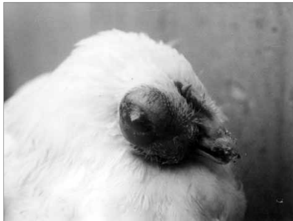
تصویر ۴- آسپرژیلوزیس چشمی در ماکیان، توده زرد رنگ داخل بافتی به خوبی نمایان می‌باشد.