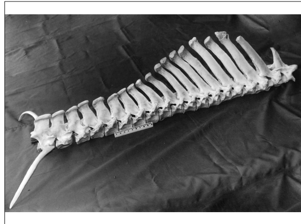
تصویر ۱ - نمای جانبی مهره‌های سینه‌ای، ۱۹ عدد مهره‌های سینه‌ای که بدنه آخرین آنها با دنده جوش خورده است.