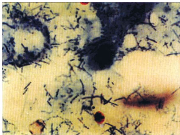
تصویر ۲- اووسیت کریپتوسپوریدیوم در گسترش مدفوع بزرگنمایی (H&E × ۱۲۵۰).