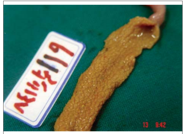
تصویر ۱- وجود مناطق وسیع نکروز در ناحیه ژژنوم پرنده تلف شده.

تعداد تلفات در گروه چالش ای که جیره حاوی ۴۰ درصد پودر ماهی را دریافت کرده بود به مراتب بیشتر بود. این تفاوت در تعداد تلفات از لحاظ آماری نیز قابل توجه بود. در کالبدگشایی پرندگان تلف شده ناشی از آنتریت نکروتیک، ضایعات تیپیک بیماری بیشتر در ناحیه ژژنوم ملاحظه گردید، اگر چه در مواردی ضایعات بیماری در ناحیه دئودنوم روده نیز آشکار بود.