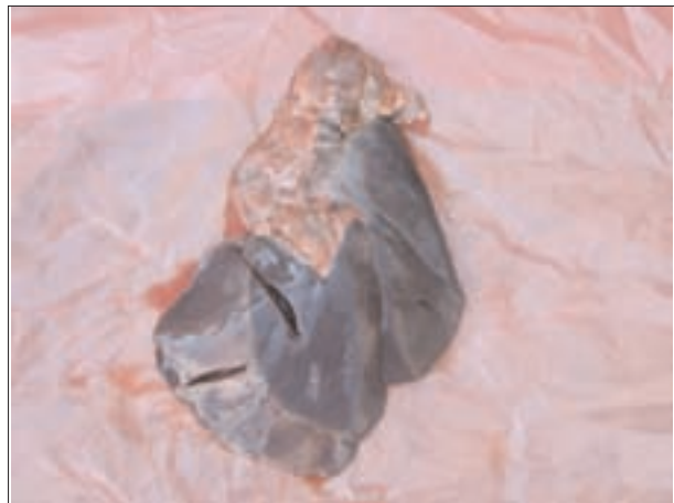
تصویر ۳- کبد گوساله مارال مبتلا به آندوتوکسمی ناشی از عفونت توام اشرشیاکلی و کلبسیلا پنومونیه، پر خونی شدید بافت کبد مشهود است.