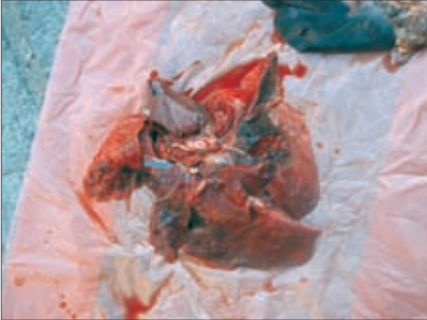
تصویر ۲- ریه گوساله مارال مبتلا به آندوتوکسمی ناشی از عفونت توام اشرشیاکلی و کلبسیلا پنومونیه، پرخونی شدید و ادم ناشی از شوک ریوی جلب توجه می‌کند.