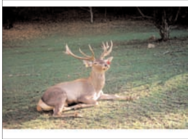
تصویر ۱- عکسی از یک گوزن قرمز نر بالغ زیر گونه مارال در آینالو، منطقه حفاظت شده ارسباران (آذربایجان شرقی).