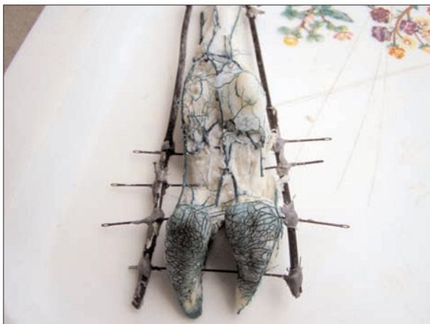
تصویر ۲ - نمونه‌ای از قالب‌های (کست‌ها) تهیه شده (رنگدانه سبز رزین عروق را سبز نشان می‌دهد).