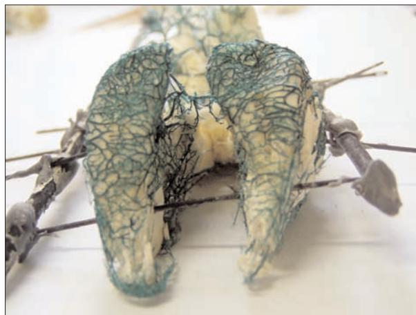
تصویر ۱ - نمونه‌ای از ایجاد داربست برای تثبیت کست‌ها.