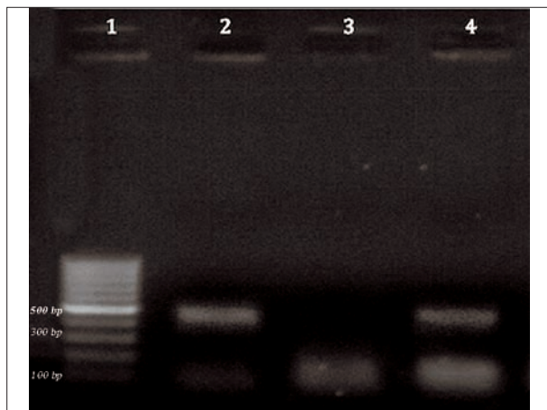
تصویر ۲ - نتایج الکتروفورز محصولات PCR ماهیان مورد آزمایش. ردیف ۱: نردبان ژنی استاندارد (100 bp). ردیف‌های ۲: شاهد مثبت، ردیف ۳: شاهد منفی، ردیف ۴: نمونه مثبت آلوده به مایکوباکتریوم.