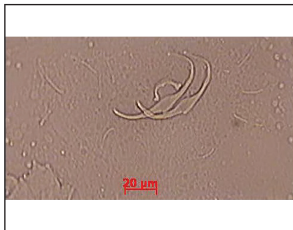
تصویر ۳. ۱۵ کیلوژیرومی فورموزومی بزرگنمایی ۴۰ برابر (عدسی شیئی).