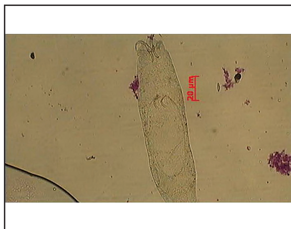
تصویر ۴. ژیرود ۱۵ کیلوسی sp. بزرگنمایی ۱۰ برابر (عدسی شیئی).

بنابراین اگرچه حضور برخی مونوژن‌های یافت شده در این بررسی، در ماهیان کپور ایران تا کنون گزارش نشده است، اما به دلیل قرابت ژنتیکی کپور ماهیان و گلدفیش امکان شیوع و همه گیری آن‌ها در میان ماهیان کپور تحت شرایط مناسب (درجه حرارت، شوری و ...) وجود داشته، بطوریکه انگل‌های مذکور قابلیت ایجاد سیستم انگل میزبان در میزبان جدید را داشته و تحت شرایط مناسب احتمال بروز همه گیری آن‌ها در ماهی کپور و ایجاد خسارات مونوژنیازیس ناشی از آن‌ها بعید نخواهد بود. البته در شرایط اخیر مشخص نیست که آیا گونه‌های میزبانی که میزبان اصلی انگل نیستند تا چه حدی قادر به ایجاد شرایط مناسب برای تولید مثل موفقیت آمیز انگل خواهند بود.