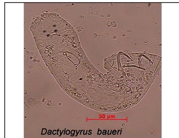
تصویر ۱. ۱۵ کیلوژیروس بائری بزرگنمایی ۱۰ برابر (عدسی شیئی).