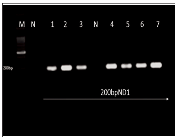
تصویر ۲. الکتروفورز ژل ۱/۵ درصد محصول PCR ناحیه ژنومی ND1 دیکروسلیوم دندردیتیکوم قطعات تکثیر شده ۲۰۰ bp، ۳-۱ ایزوله گاو، ۴، ۵، ۶، ۷ بزی نمونه گیری شده از کشتارگاه استان مرکزی، (N) کنترل منفی، (M) مارکر وزنی ۱۰۰ bp.

نشخوارکنندگان استان مرکزی می‌شود. یکی از شاخص‌های مرفومتريک قابل اعتماد و مهم برای تشخیص افتراقی گونه‌های دیکروسلیوم، موقعیت قرار گرفتن بیضه‌ها می‌باشد. مطالعه Otranto و همکارانش در سال ۲۰۰۷ که بر روی گوسفندان اتریشی، آلمانی و ایتالیایی آلوده به ترماتود کبیدی دیکروسلیوم صورت گرفته بود، نشان داد در تمامی ایزوله‌های دیکروسلیوم چاینسیس دو بیضه در کنار هم قرار دارد، ولی در ایزوله‌های دیکروسلیوم دندردیتیکوم موقعیت قرار گرفتن بیضه‌ها پشت سرهم می‌باشد. همچنین پهنای بدن در قسمت میانی دیکروسلیوم چاینسیس نسبت به دیکروسلیوم دندردیتیکوم بیشتر می‌باشد (۱۵). یافته‌های تحقیق حاضر نشان داد، بیضه‌ها در تمامی ایزوله‌ها موقعیت پشت سرهم دارد که بدین ترتیب می‌توان نتیجه گرفت، تنها عامل دیکروسلیازیس در استان مرکزی، دیکروسلیوم دندردیتیکوم می‌باشد. Taira و همکاران وی در سال ۲۰۰۶ با استفاد از این شاخص، تنهاگونه آلوده کننده آهوی ika در ژاپن را دیکروسلیوم چاینسیس تشخیص دادند (۱۸). شاخص مهم دیگر اندازه طول و عرض