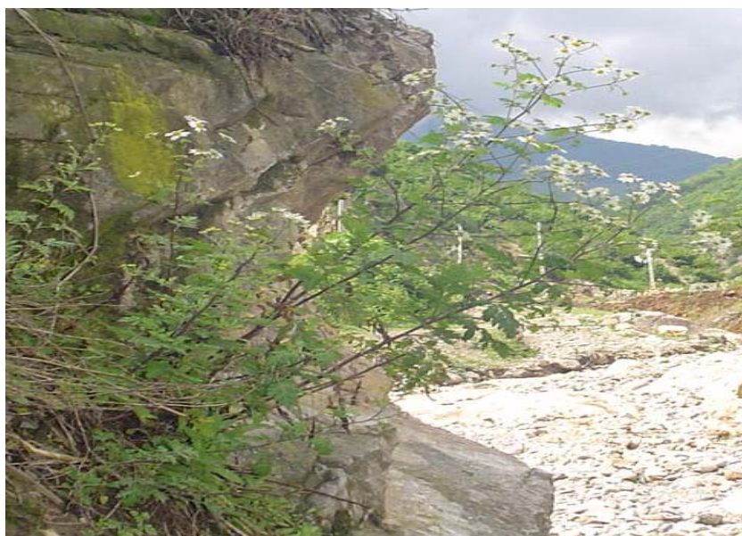
شکل ۱- تصویری از گیاه Tanacetum parthenium در منطقه زیارت