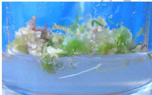
شکل ۲- تولید ریشه در کالوس در محیط فاقد هورمون