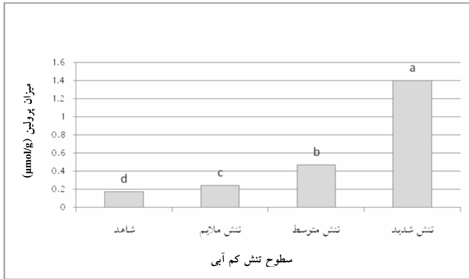
شکل ۱- اثر سطوح تنش خشکی بر میزان تجمع پرولین در برگ‌های آویشن ( Thymus vulgaris L. )