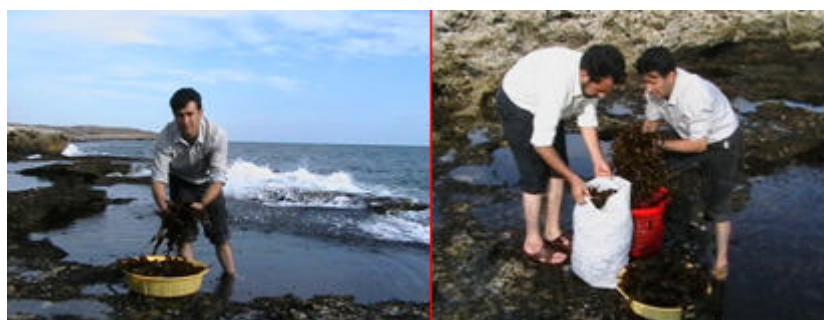
شکل ۱- نحوه جمع‌آوری استوک از دریا

یافته و جلبکهای سارگاسوم، سیستوسیرا و هیپنئا با توجه به میزان رویش آنها در این مناطق توسط کاردک فلزی استیل جمع‌آوری و داخل سبدهای پلاستیکی گذاشته و برای جلوگیری از تابش شدید نور آفتاب و خشک شدن جلبکها، گونی کفنی بر روی آنها قرار داده شد تا در کمترین زمان به سایت پرورش منتقل گردند (شکل ۱).