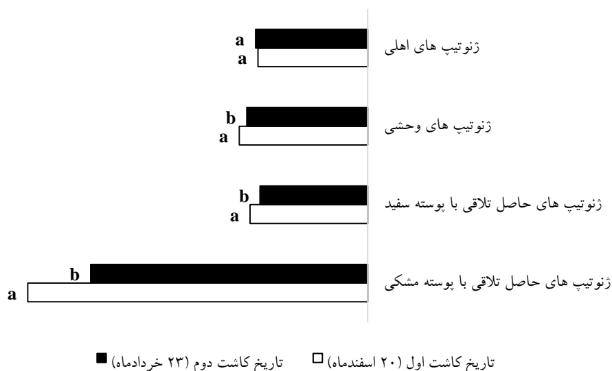
شکل ۲- روند اثر متقابل تاریخ کاشت و ژنوتیپ مربوط به محتوی فنل تام بذر (ژنوتیپ‌های با حرف مشابه اختلاف معنی‌داری در دو تاریخ کاشت ندارند).

برخلاف محتوی فنل تام بذر که روند خاصی را در هر دو تاریخ کاشت در تمامی گروه‌های ژنوتیپی نشان داد، محتوی فنل تام برگ روند مشابهی نداشت. در ژنوتیپ‌هایی با پوسته سفید (زراعی و حاصل تلاقی) مقادیر این صفت در تاریخ کاشت دوم در مقایسه با تاریخ کاشت اول بیشتر بود. در ژنوتیپ‌های وحشی با پوسته رنگی بیشترین محتوی فنل