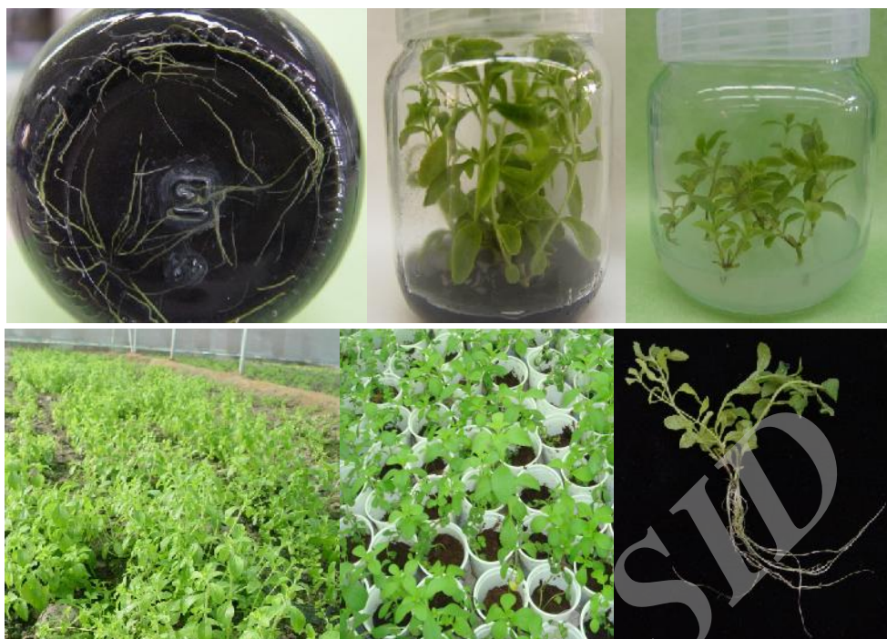
شکل ۱- نمایشی از مراحل مختلف تولید گیاهچه‌های کشت بافتی استویا از مرحله استقرار، پرآوری و ریشه‌زایی تا انتقال به خاک در سطح تولید نیمه انبوه

جدول ۲- تأثیر ترکیب هورمونی محیط کشت بر تعداد شاخه اصلی، تعداد شاخه فرعی، تعداد میانگره، طول شاخه اصلی، طول شاخه فرعی و طول میانگره حاصل از کشت ریزنمونه جوانه جانبی گیاه استویا در مرحله پرآوری