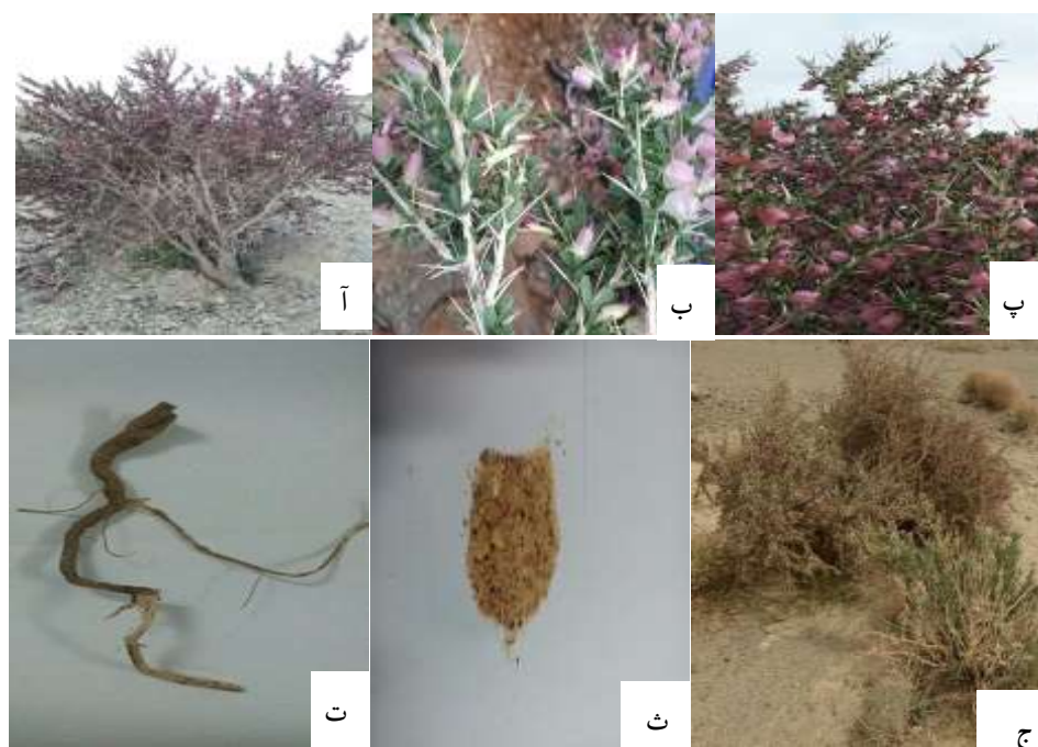
شکل ۲- گونه A. fasciculifolius در رویشگاه سراوان

آ: درختچه انزروت، ب: اوج مرحله رویشی و اوایل گلدهی، پ: اوج مرحله گلدهی، ت: نمونه‌ای از ریشه انزروت، ث: صمغ گیاه انزروت، ج: گیاه انزروت همراه با گونه Rhazya stricta (سمت راست تصویر)