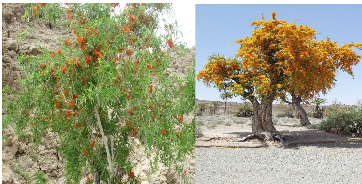
شکل ۲- نمایی از مورفوتیپ زرد (رویشگاه مغان شابو) و نارنجی (رویشگاه دامن) انار شیطان در منطقه بلوچستان