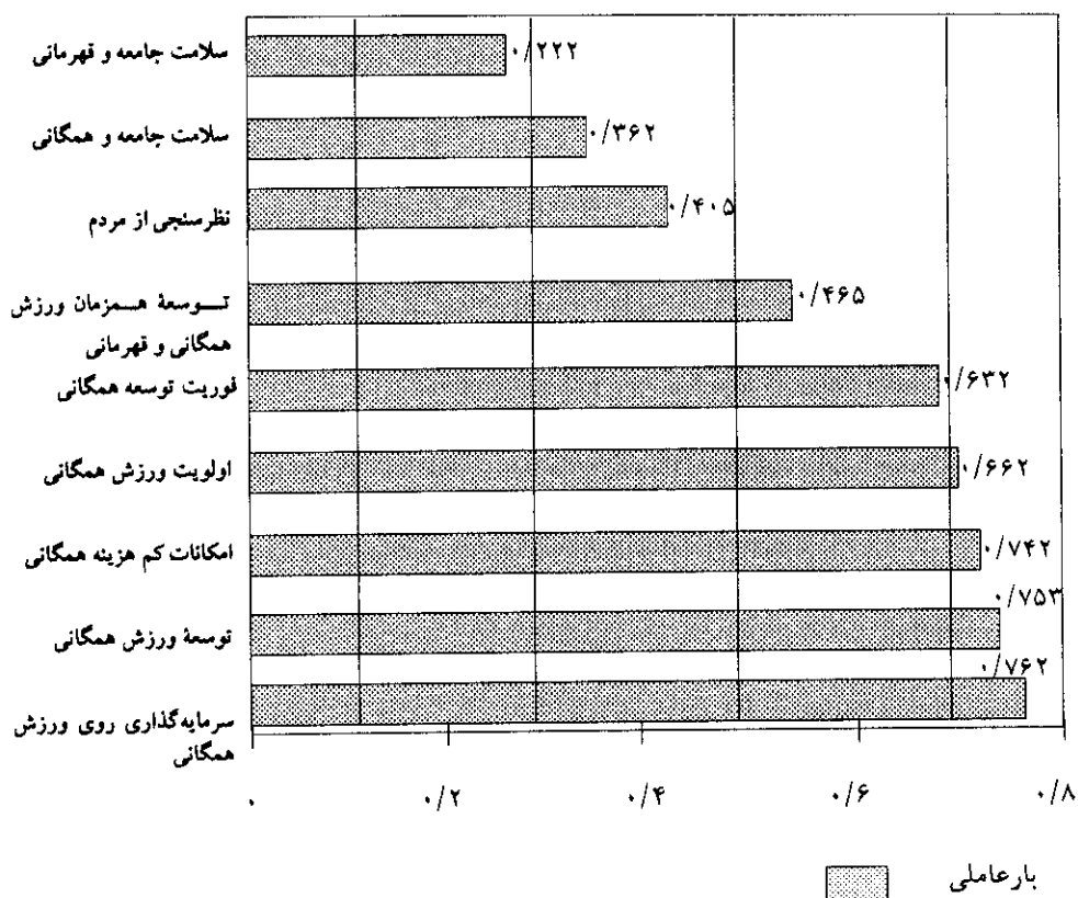
نمودار ۱- بار عاملی اجزای درونی متغیر تقاضای اجتماعی برای ورزش همگانی و قهرمانی

این است که گسترش ورزش همگانی را سرلوحه برنامه‌های دراز مدت خود قرار دهند. در غیراین صورت باید در انتظار آمارهای نگران‌کننده بیماری‌ها، غیبت از کار در اثر بیماری‌های ناشی از کم‌تحرکی، افزایش مرگ و میر و کاهش سطح بهداشت عمومی باشیم. نمودار ۱ بار عاملی هر کدام از اجزای درونی متغیر تقاضای اجتماعی برای ورزش همگانی و قهرمانی را نشان می‌دهد.