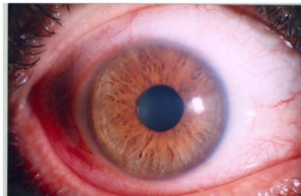
تصویر ۲- همان چشم دو هفته پس از درمان که شفاف شدن قرنيه را نشان می‌دهد.

کراتیت لایه‌ای منتشر (DLK) بعد از لیزیک، یک فرآیند التهابی استریل است که احتمالات زیادی به عنوان علت آن ذکر شده‌اند ولی هیچ‌کدام قطعی نیستند؛ گرچه در مواجهه با آن باید کراتیت‌های عفونی و قارچی نیز در مد نظر باشند. Smith و Maloney ۳ دو مورد از ترشحات DLK را کشت دادند و هیچ یافته‌ای از قارچ، باکتری و یا میکوباکتریوم یافت نکردند. احتمال دیگری که برای DLK ذکر شده است؛ زمینه‌های مستعد خود فرد نسبت به واکنش‌های التهابی هستند و مشخص نیست چرا در بعضی افراد DLK به صورت خیلی خفیف ولی در بعضی دیگری خیلی شدید اتفاق می‌افتد. ارتشاح مختصر گویچه‌های