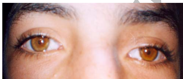
تصویر ۴- شش ماه پس از عمل جراحی ویتراکتومی عمیق که قطر مردمک چشم راست نیز طبیعی شد.