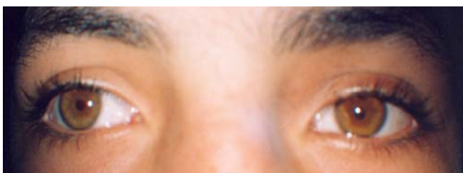
تصویر ۲- بعد از چکاندن قطره پیلوکارپین ۰/۱ درصد: مردمک چشم چپ تغییری نکرد ولی مردمک چشم راست میوتیک شد.

راست در قسمت تحتانی زجاجیه، حدود ساعت ۶، یک جسم بیگانه به ظاهر فلزی به اندازه حدود یک میلی متر، به صورت شناور مشاهده شد. در قسمت تحتانی شبکیه در نزدیکی مکان قرارگیری جسم بیگانه، تغییرات پیگمانته به صورت هایپر و هایپویگمنتیشن مشاهده شد (تصویر ۳). هیچ اسکاری در قرنیه، صلبیه و لیمبوس، ناشی از ورود جسم بیگانه، مشاهده نگردید. پرتونگاری ساده از کاسه چشم، جسم بیگانه حاجبی را نشان داد. استفاده از قطره پیلوکارپین ۰/۱ درصد در مراجعات بعدی، بیش حساسیتی (hypersensitivity) به پیلوکارپین را در