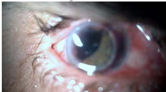
تصویر ۱- جداشدگی جوشگاه پیوند و خارج شدن لنز داخل چشمی به دنبال ضربه

وجود نداشت. هم‌چنین در هیچ‌کدام از موارد، اندوفتالمیت یا زخم عفونی قرنیه مشاهده نگردید و فشار داخل چشمی پس از ترمیم ثانویه، در همه بیماران، در حد طبیعی حفظ شد و نیاز به مصرف داروی ضد گلوکوم نبود.