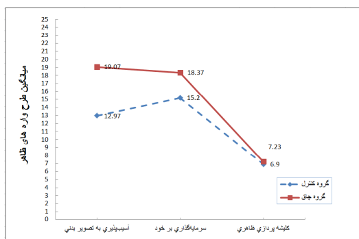
شکل ۲. میانگین و انحراف معیار طرح‌واره‌های ظاهر به تفکیک دو گروه مبتلا به چاقی و گروه کنترل

شکل ۱ نشان می‌دهد که میانگین طرح‌واره‌های ناسازگار اولیه به جز طرح‌واره رهاشدگی، در گروه مبتلا به چاقی بیش از گروه کنترل است و تفاوت طرح‌واره‌های ایثار و بازداري هیجانی در دو گروه مورد مطالعه به صورت معنی‌داری بیش‌تر از سایر طرح‌واره‌هاست.