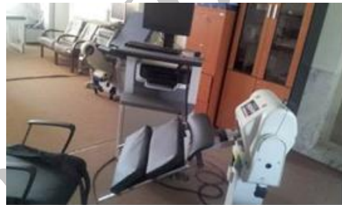
شکل ۱. ابزار الحاقی طراحی شده جهت دستگاه بایودکس مدل Pro4

پس از قرار گرفت داوطلبین روی ابزار الحاقی و قبل از شروع انجام آزمون، در قسمت تنظیمات دستگاه دامنه چرخش داینامومتر در هر طرف ۴۵ درجه تعریف گردید و سپس با استفاده از کلید Adjust weight وزن تنه داوطلب محاسبه گردید تا اثر نیروی وزن تنه بر گشتاور عضلانی حذف گردد. برای اندازه‌گیری گشتاور چرخشی تنه با انقباضات ایزومتریک و ایزوکینتیک به صورت کانستریک، ابتدا ماهیت و تعداد حرکات و نحوه‌ی انجام تست به بیمار آموزش داده شد.