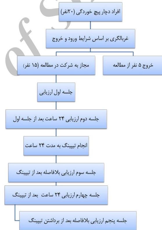
شکل ۱: فلوچارت مطالعه

و اندازه‌گیری نوسانات مرکز فشار در وضعیت‌های بدون اغتشاش، اغتشاش قدامی خلفی و اغتشاش طرفی شرکت کند. جهت جلوگیری از اثر یادگیری، ترتیب انجام این وضعیت‌ها به طور تصادفی و با انتخاب یکی از ۶ کاردتی که شامل ترکیب‌های مختلف این ۳ آزمون بود توسط فرد مورد آزمون مشخص می‌شد. جلسات ارزیابی شامل: جلسه اول ارزیابی در روز اول مراجعه، جلسه دوم ارزیابی در روز دوم قبل از انجام KT، جلسه سوم ارزیابی در روز دوم بلافاصله بعد از انجام KT، جلسه چهارم ارزیابی در روز سوم تست (۲۴ ساعت بعد از نصب KT) و جلسه پنجم نیز در روز سوم تست و بلافاصله بعد از برداشتن KT انجام شد (شکل ۱).