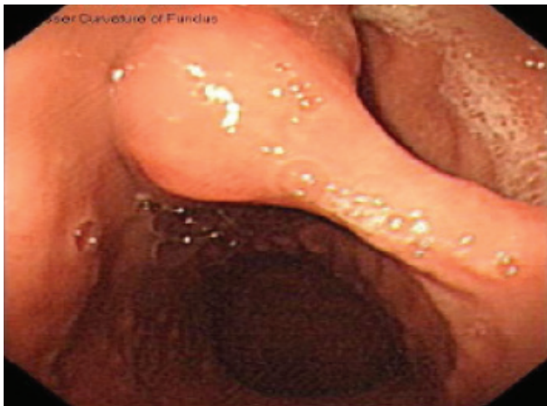
شکل ۱. اندوسکوپی یک پولیپ بزرگ پدانکوله در قسمت میانی انحنا بزرگ معده را نشان میدهد

سانتیمتر که از بخش پایه گرفته شد با موفقیت بدون خونریزی بعدی انجام گرفت. معاینه هیستولوژیک ضایعه نشان داد که ضایعه پولیپوئید خارج شده دارای اندازه 2/5 \times 1/5 \times 1/5 سانتیمتر و با ساقه کوتاه بود. در قطعات بریده شده بافت، تعدادی از کیست‌های پر شده از مومین کوچک با زمینه استرومای مایل به صورتی مشاهده شد. معاینه میکروسکوپی سطح پولیپ، موکوس نوع آنترال با متابلازی فوکال سلول‌های گابلت و التهاب مزمن متوسط را نشان داد. در عمق پولیپ‌ها تعدادی غدد کیستیک در باندهای غیرارگانیزه و متراکم از عضلات صاف موسکولاریس موکوزا قرار گرفته بودند. این غدد حاوی اپی تلیوم صاف یا گلاندولار بودند و توسط یک حاشیه لامینا پروپریا احاطه شده بودند. دیسپلازی یا بدخیمی در ضایعه مشخص نشد و در نهایت تشخیص پاتولوژی گاستریت پولیپوز سیستیک GCP داده شد (شکل ۳ a و b).