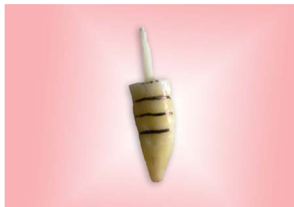
شکل ۱- ریشه علامت گذاری شده

قطر پست استفاده شده در این تحقیق ۱/۵ میلی‌متر و ضخامت نمونه‌ها ۲ میلی‌متر بود. برای آنالیز داده‌ها از برنامه‌های آماری ANOVA, one-sample Kolmogorov-Smirnov و T-test با P < 0.05 به عنوان سطح معنی‌داری استفاده شد. کلیه عملیات آماری با استفاده از نرم افزار SPSS، ویراست ۱۱/۵، تحت ویندوز XP انجام پذیرفت.