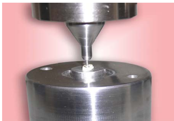
شکل ۳- تماس crosshead با سطح پست

(شکل ۳). برای تشخیص پست از سیمان و عاج اطراف آن، سطح پست در سمت اپیکال هر قطعه با مازیک ضد آب رنگ شده بود.