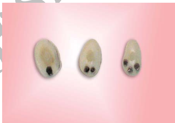
شکل ۲- قسمت های تاجی، میانی و انتهایی ریشه به ترتیب از سمت چپ

کرونا، یک سوم تاجی، یک سوم میانی و یک سوم انتهایی نام‌گذاری شد. برای شناسایی این قطعات از هم روی سطح اپیکال هر قطعه یک علامت زده شد (شکل ۲).