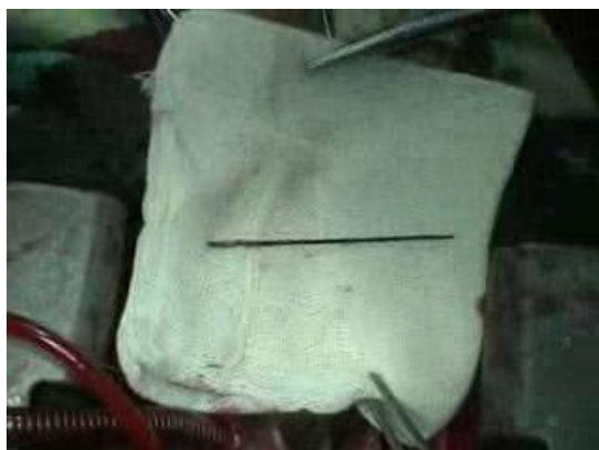
شکل ۳: سوزن خیاطی خارج شده از دهلیز راست پس از عمل جراحی باز قلب

جسم خطی شدیداً اکورفلکتیو مانند یک سوزن بزرگ را در حفره بطن چپ نشان داد که در قاعده سپتوم بین بطنی به آپکس چسبیده بود (شکل ۲).