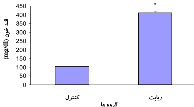
شکل ۱: تأثیر تزریق استرپتوزوتوسین بر قند خون رتهای کنترل و دیابتی. مقادیر بصورت

میزان بیان ژن BDNF توسط روش نیمه کمی یا (RT-PCR) Revers Transcription PCR اندازه‌گیری شد. بطور خلاصه RNA توتال از بافت هیپوکامپ با استفاده از محلول RNAX-Plus (سیناژن) و طبق دستورالعمل شرکت سازنده استخراج گردیده و سپس با استفاده از کیت سنتز cDNA (تهیه شده از شرکت Fermentas)، cDNA سنتز گردید. در مرحله بعد پرایمرهای طراحی شده برای ژن BDNF، شامل پرایمرهای Forward '5GAATTCATGACCATCCTTTTCCTTACTATG3' و پرایمرهای Revers '5AAGCTTCTTCCCCTTTTAATGGTCAG3' و نیز ژن بتا اکتین بعنوان ژن Houskeeping جهت کنترل و مقایسه شامل پرایمر Forward '5CCCTAAGGCCAACCGTGAAAAGATG3' و پرایمر Revers '5GAACCGCTCATTGCCGATAGTGATG3'، در واکنش PCR وارد گردید. برنامه PCR (Eppendorf AG, Germany) شامل درجه حرارت 94^{\circ}\text{C} به مدت ۴ دقیقه، 94^{\circ}\text{C} به مدت ۱ دقیقه، 55^{\circ}\text{C} به مدت ۱ دقیقه، 72^{\circ}\text{C} به مدت ۴۵ ثانیه برای ۳۳ سیکل و 72^{\circ}\text{C} به مدت ۵ دقیقه بود. پس از PCR، از محصولات PCR حاصله در ژل آگاروز یک درصد (eurobio) الکتروفورز بعمل آمده و بعد از رنگ آمیزی با اتیدیوم بروماید از آن عکسبرداری گردید. عکس‌های حاصله با استفاده از برنامه Scion Image (Scion corporation USA) آنالیز گردیده و بشکل