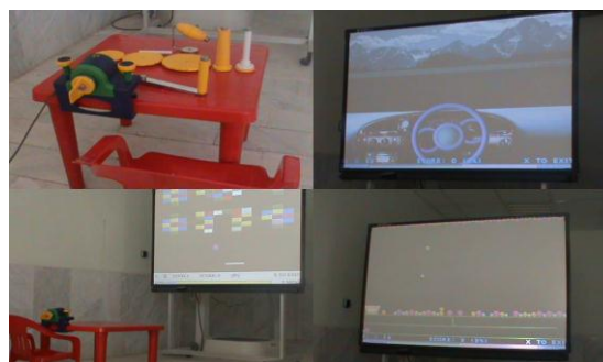
شکل ۱: سیستم واقعیت مجازی E-Link