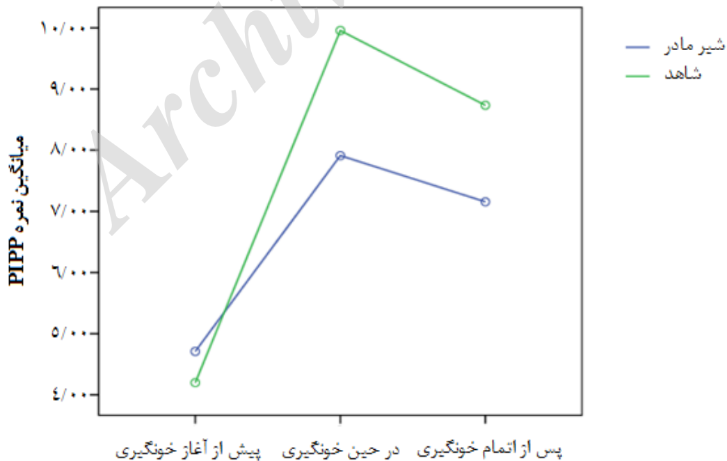
نمودار ۱: تغییرات نمره درد در زمان‌های مختلف در دو گروه مورد مطالعه

نمودار ۱: تغییرات نمره درد را در زمانهای مختلف مطالعه در دو گروه شیرمادر و کنترل نشان می‌دهد. آزمون اندازه‌گیریهای مکرر چندعامله نشان می‌دهد که در داخل گروهها تغییرات نمره درد در زمان‌های مختلف مطالعه معنی‌دار بوده است.