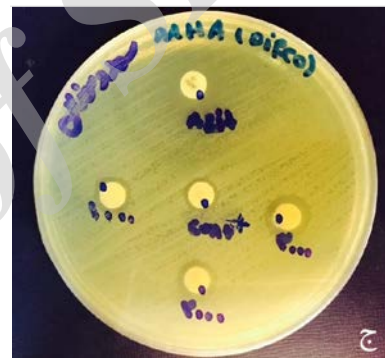
شکل ۱- تصویر میکروسکوپ الکترونی روبشی نانوذرات نقره سنتز شده توسط سویه ایزوپتريکولا واریابلیس IRSHI (الف) نمودار توزیع اندازه نانوذرات براساس آنالیز پراکندگی نوری دینامیک، (ب) اثر ضدباکتریایی نانوذرات نقره اولیه علیه باکتری سودوموناس آئروژینوزا در غلظت‌های ۱۰۰۰، ۲۰۰۰ و ۳۰۰۰ میکروگرم بر میلی‌لیتر، (ج) کنترل مثبت آزیترومایسین