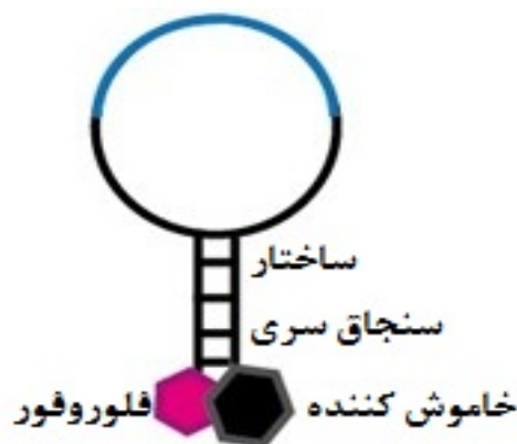
شکل ۳- ساختار پروب Molecular Beacon

پروب Molecular Beacon اولین بار توسط تایگی و کارمر معرفی شد. این پروب، الیگونوکلئوتیدی تک‌رشته‌ای به شکل سنجاقتی سر است که به چهار بخش تقسیم می‌شوند: (الف) یک لوپ که قطعه‌ای ۱۸ تا ۳۰ جفت بازی است و با توالی DNA هدف مکمل می‌باشد؛ (ب) یک ساقه که توسط دو توالی مکمل ۵ تا ۷ جفت بازی واقع در دو انتهای پروب ایجاد می‌شود؛ (پ) یک مولکول گزارش‌گر فلورسنت که به انتهای ۵' متصل شده است؛ (ت) یک کوئنچر بدون فلورسنت که به انتهای ۳' متصل شده است و زمانی که پروب به شکل بسته خود می‌باشد، فلورسنت ساطع شده از مولکول گزارش‌گر را جذب می‌کند (۲۴) (شکل شماره ۳).