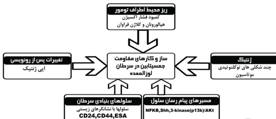
شکل ۲- ساز و کارهای ایجاد مقاومت نسبت به جمسیتابین در سرطان لوزالمعده

کارایی درمان با جمسیتابین علاوه بر میزان ورود دارو به مقدار زمانی که دارو در معرض سلولها قرار می‌گیرند هم وابسته است. در این راستا تنوع ژنتیکی در پروتئین‌های غشایی خانواده (MRP; Multidrug resistance protein) که در خارج کردن دارو و کاهش مجاورت سلول با دارو نقش ایفا می‌کنند، مورد مطالعه قرار گرفته است. نتایج بررسی مقایسه تاناکا و همکارانش نشان داد که جمعیت دارای ژنوتیپ‌های G40A و MRP5 A2G پاسخ‌گویی کم‌تری به دارو نشان دادند. (۱۹) DCK به دلیل فراهم کردن دزوکسی نوکلئوتید تری فسفات (dNTPs) نقش تعیین‌کننده در تنظیم سرعت همانندسازی و ترمیم DNA دارد. از میان واریانت‌های متعددی که برای این ژن شناخته شده تنها سه واریته مسئول اختلاف در مقدار فعالیت آنزیمی این پروتئین می‌شوند. به‌طور مثال در افراد با ژنوتیپ <math>1205C>T</math> و <math>984A>G</math> پاسخ کم‌تری نسبت به جمسیتابین گزارش شده است (جدول شماره ۱). (۲۰)