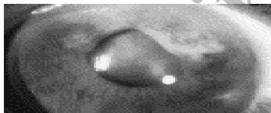
شکل ۲: نمای تومور مولتی ندولر پس از رادیوتراپی