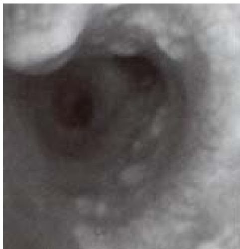
شکل ۲: نمای برونکوسکوپی TO