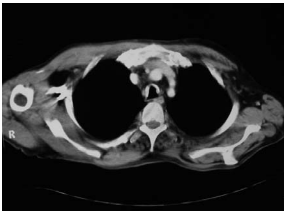
شکل ۱: نمای سی تی اسکن TO

فیبراپتیک قرار گرفته که ضایعات ندولار سفید رنگ با قوام سفت در طول تراشه و برونش‌های اصلی مشاهده شد (شکل ۲) از یک ندول بیوپسی گرفته شد که یافته‌های بافت‌شناسی به طور تیبیک ندولهای غضروفی و استخوانی بوده که در ساب ماکروس قرار دارند (شکل ۳). بیمار با تشخیص TO برای لیزر درمانی انتخاب شد.