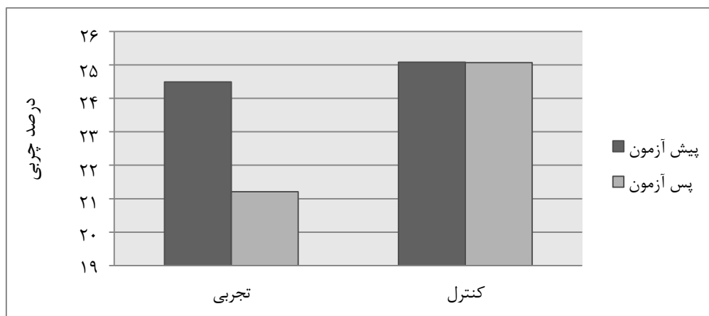
نمودار ۳: مقایسه تغییرات درصد چربی در گروه تجربی و کنترل قبل و بعد از دوره تمرین