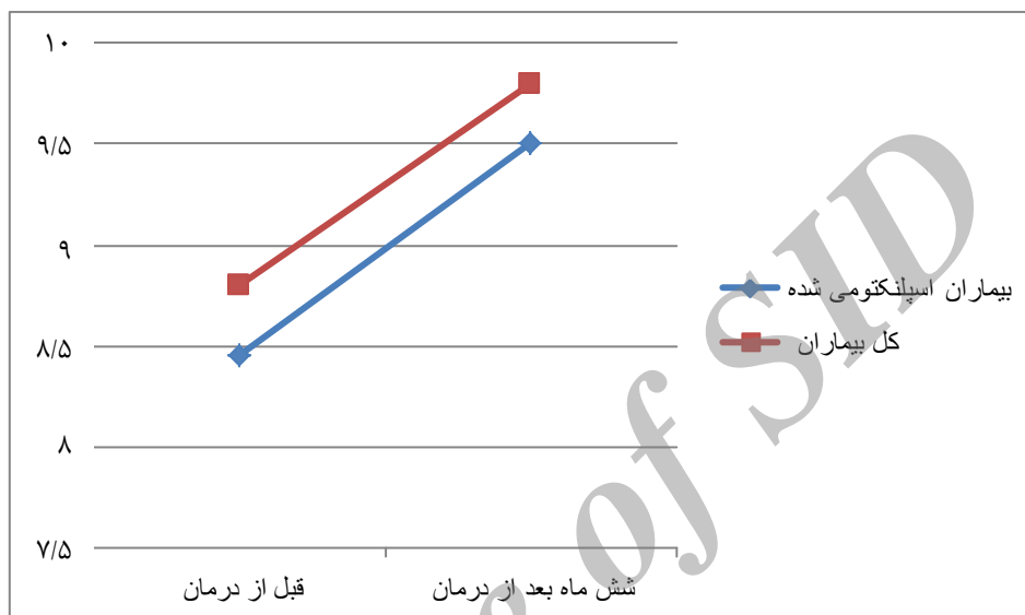
نمودار ۳: تغییرات میانگین هموگلوبین در کل بیماران و اسپلنکتومی شده

از بین بیماران مورد مطالعه ۹ نفر (۱۴/۲۸٪) اسپلنکتومی شده بودند که در پایان ۶ ماه درمان با هیدروکسی اوره، ۷ نفر (۷۷/۷۷٪) به طور کامل از تزریق خون بی نیاز شده و ۲ نفر (۲۲/۲۲٪) افزایش فواصل تزریق خون به بیش از یک ماه را داشته اند. در پایان ۶ ماه درمان با هیدروکسی اوره، میانگین هموگلوبین کل بیماران افزایش معنی‌دار و میانگین فریتین کل