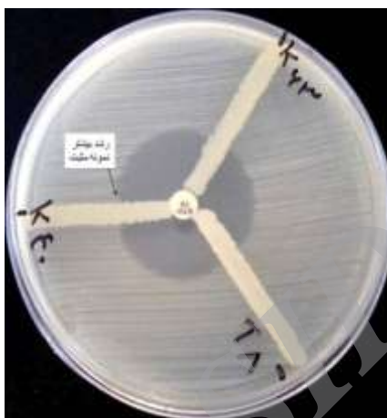
شکل ۱: در تصویر راست، تست فنوتیپ MHT برای تشخیص تولید کرباپنماز: K40، مثبت؛ T8 و K63، منفی.

در تصویر چپ، یافته‌های PCR برای ژن blaVIM : چاهک L، Ladder 100 bp؛ چاهک ۱، کنترل منفی؛ ۲، کنترل مثبت؛ ۳، نمونه منفی؛ ۴، ۵ و ۶، دارای ژن blaVIM