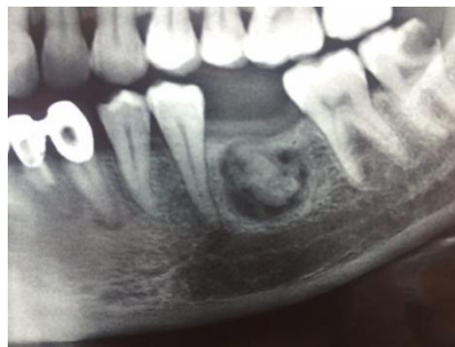
تصویر ۱: نمای پانورامیک ضایعه قبل از جراحی

در نمای بالینی تورم مختصر دردناک در سمت چپ مندیبل مشاهده گردید. مخاط دهان کاملاً سالم بود. بیمار تحت بیوپسی اکسیژنال قرار گرفت. بافت ارسال شده به آزمایشگاه حاوی چندین قطعه بافت نرم و سخت به رنگ کرم-قهوه‌ای در ابعاد ۲۵×۷×۵mm بود. بافت‌های نرم و سخت به ترتیب در محلول‌های فرمالین ۱۰٪ و اسید نیتریک قرار داده شدند.