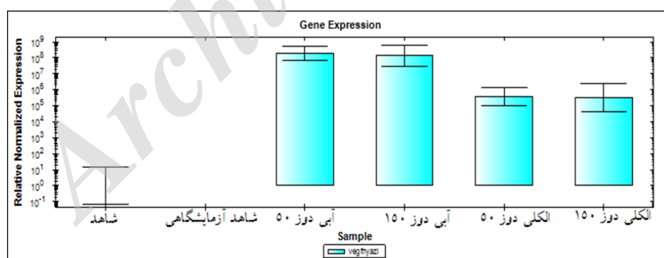
نمودار ۱: مقایسه میزان بیان ژن VEGF در گروه‌های مورد مطالعه