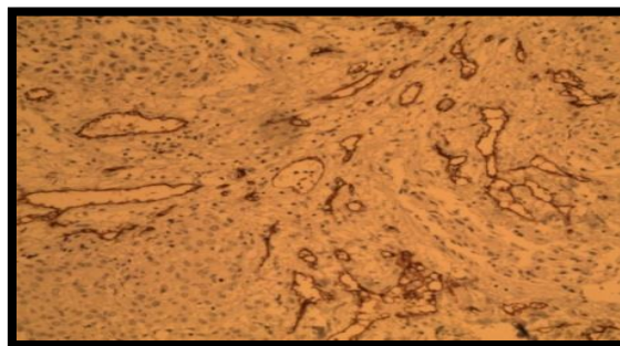
تصویر ۳: رنگ پذیری شدید موکوپایدرموئید کارسینوما با نشانگر CD34 (×۱۰۰)

جدول ۱: مقایسه تراکم ریزعروق خونی در درجات مختلف بافت شناختی موکوپایدرموئید کارسینوماهای بزاقی