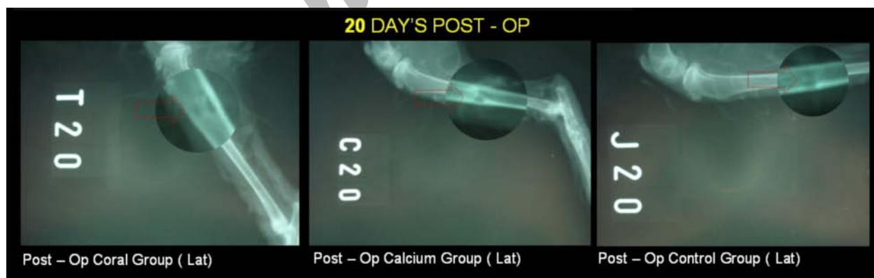
تصویر ۴) روز ۲۰ بعد از عمل - موقعیت خوابیده به یک طرف - گروه کنترل (سمت راست)، گروه کلسیم (وسط)، گروه مرجان (سمت چپ)