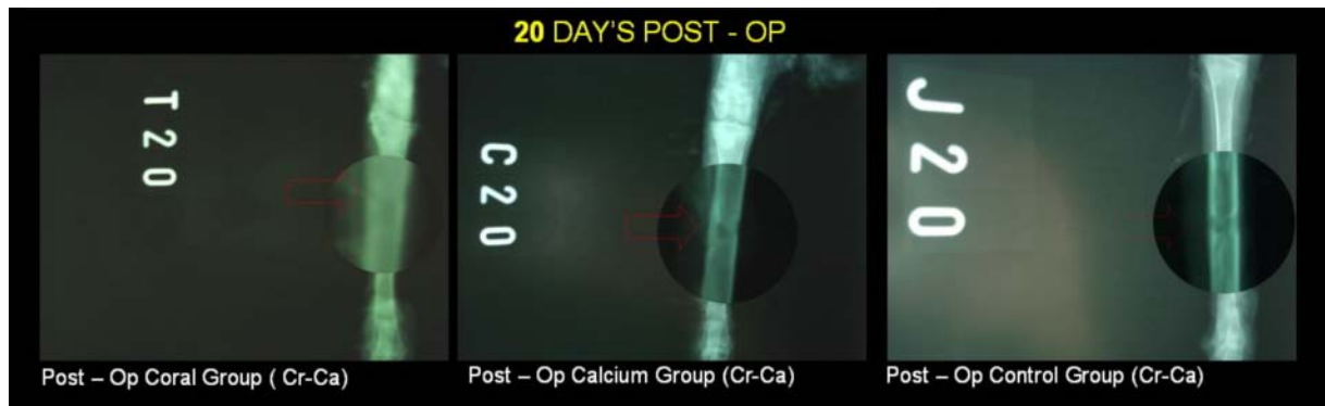
تصویر (۵) روز ۲۰ بعد از عمل - موقعیت جلویی پستی - گروه کنترل (سمت راست)، گروه کلسیم (وسط)، گروه مرجان (سمت چپ)

ارزیابی پارامترهای التیامی استخوان به صورت خیلی خوب (+ + +) و بدون کالوس خارجی بود (تصاویر ۷،۶ و ۸)