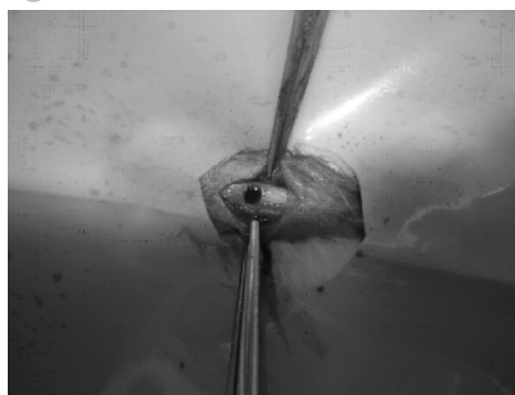
تصویر ۱) ایجاد نقیصه در موضع عمل

در هر ۳ گروه مورد بررسی بخش یک سوم بالایی استخوان درشتنی برای جراحی به کار رفت و با ایجاد شکاف به طول ۳ سانتی متر از پایین مفصل زانو تا قسمت میانی استخوان درشتنی در قسمت جانبی بدون برش عضله با روش کندکاری با کنارزدن پوست استخوان درشتنی در معرض دید قرار گرفت. با مته اورتوپدی به قطر ۴ میلی متر سوراخی و عمق ۰/۶ - ۰/۸ میلی متر در بخش یک سوم بالایی استخوان درشتنی ایجاد شد (تصویر ۱) و با خارج کردن قطعات استخوان و شستشوی نقیصه ایجاد شده، پوست با الگوی بخیه ساده تک با نخ نایلون ۳ صفر بخیه شد.