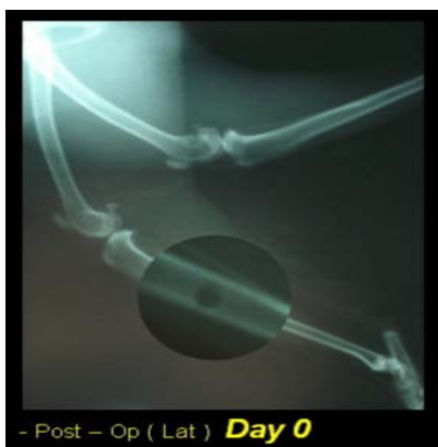
تصویر ۳) روز صفر- سوراخ ایجاد شده در قسمت یک سوم بالای استخوان درشتنی- موقعیت خوابیده به یک طرف

در ارزیابی پارامترهای التیامی استخوان در روز ۲۰ نتایج زیر حاصل شد: