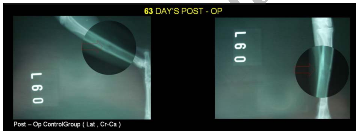
تصویر ۸) روز ۶۳ بعد از عمل - موقعیت جلویی پشتی - گروه کنترل (سمت راست). موقعیت خوابیده به یک طرف - گروه کنترل (سمت چپ)

در ارزیابی رادیولوژی پارامترهای التیامی استخوان که شامل پرشدن نقیصه، دانسیته نقیصه، کالوس خارجی، کالوس اینترکورتیکال و ارزیابی کلی می باشد جداول میانگین و انحراف معیار بر اساس آزمون آنالیز واریانس یک طرفه و تست شفه تنظیم گردید و نتایج آماری زیر حاصل شد: