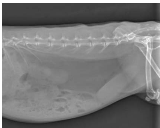
تصویر ۹) موقعیت خوابیده به یک طرف و عدم وجود سنگ در محوطه بطنی از خرگوش های گروه مرجان و کلسیم

با توجه به جدول ۲ اختلاف معنی داری بین دو گروه مرجان و کنترل دیده می شود ( P < 0.05 ) ولی در بین دو گروه مرجان و کلسیم اختلاف معناداری وجود ندارد ( P > 0.05 ).