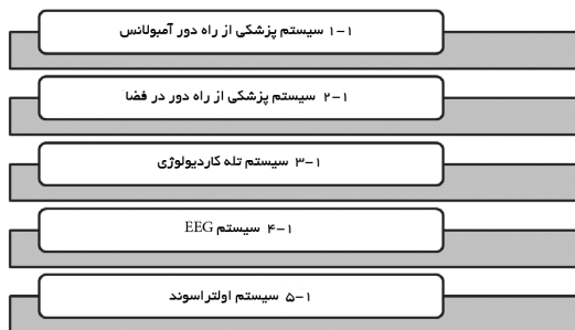
نمودار ۱) انواع سیستم‌های بیسیم و سیار در پزشکی از راه دور بر اساس فن‌آوری‌های بیسیم و نوع خدمات

انواع سیستم‌های بیسیم و سیار در پزشکی از راه دور بر اساس فن‌آوری‌های بیسیم و نوع خدمات ارائه دهنده: طبق مطالعات انجام شده انواع سیستم‌های بیسیم و سیار در پزشکی از راه دور طراحی شده تا به حال در نمودار ۱ نشان داده شده است.