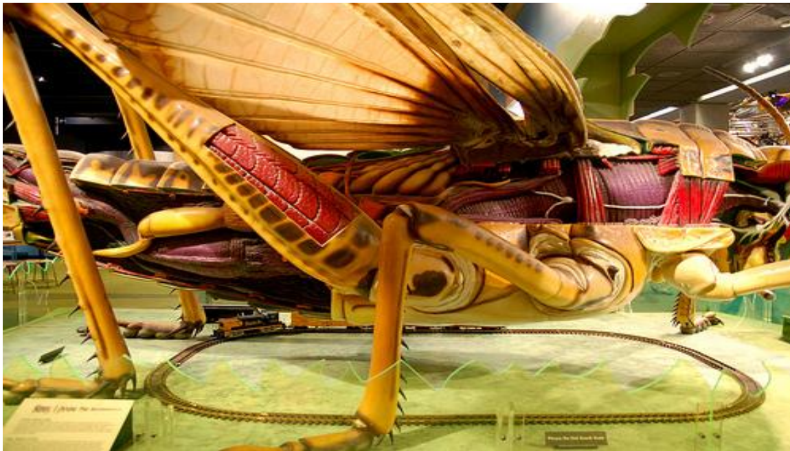
تصویر ۱۰) سالن زیست پزشکی (۱۳۹۳)