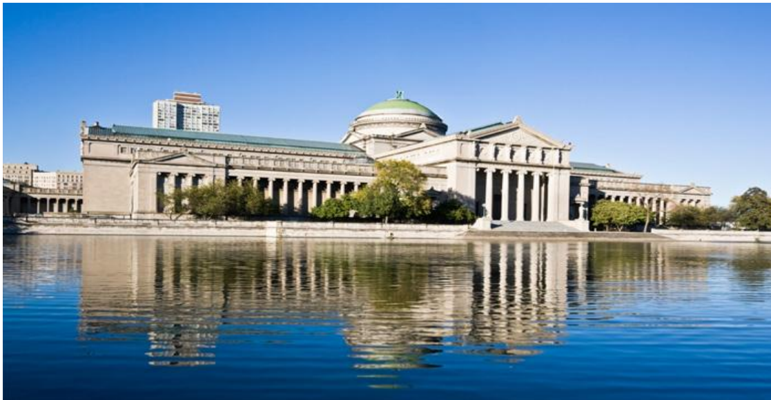
تصویر ۱۲) نمای بیرونی موزه علم و صنعت شیکاگو

( http://dn.educationaltravel.com/sites/museum-of-science-and-industry-2/ )