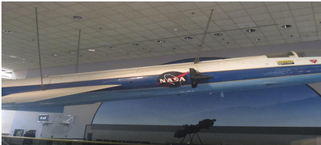
تصویر ۲۱) موزه ملی هوا فضا واشنگتن DC (۱۳۹۰)