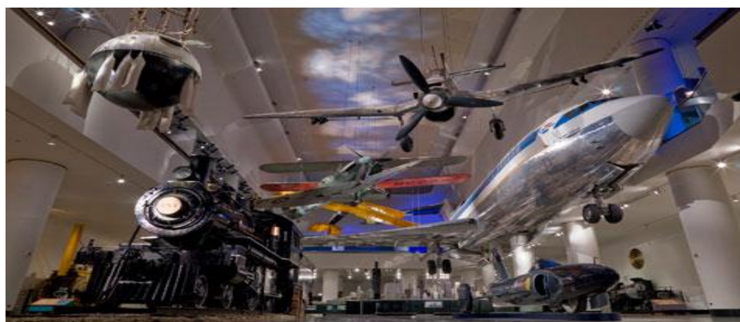
تصویر ۱۵) موزه ملی هوا فضا واشنگتن DC (۱۳۹۰)