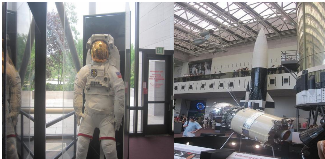
تصویر ۱۴) موزه ملی هوا فضا واشنگتن DC (۱۳۹۰)