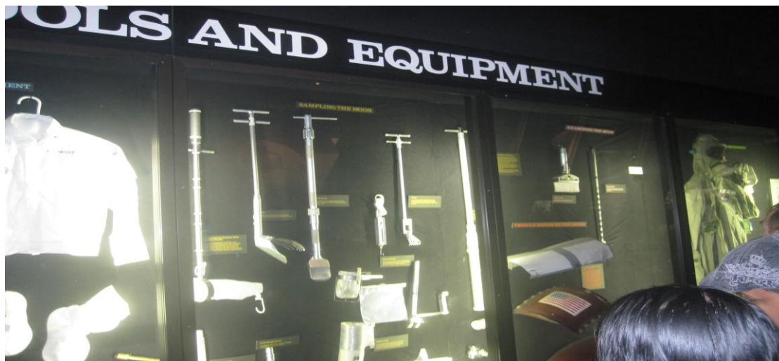
تصویر ۱۷) موزه ملی هوا فضا واشنگتن DC (۱۳۹۰)

یک مثال دیگر از موزه‌های علم و فناوری، موزه‌ی ملی هوا و فضا واقع در Washington D.C است که بزرگ‌ترین مجموعه‌ی تاریخی فضاپیماها و هواپیماها را در بر می‌گیرد. این موزه در سال ۱۹۴۶ ساخته شده است. سالانه حدود ۶/۷ میلیون نفر از این موزه بازدید می‌کنند و این موزه رتبه‌ی ۵ دنیا را در تعداد بازدیدکنندگان دارا می‌باشد. این موزه علاوه بر سالن‌های بازدید، بخش‌هایی نیز برای تحقیقات در زمینه‌ی هواپیما، فضاپیما، علوم ژئولوژی و ژوفیزیک دارد. در این موزه تمامی فضاپیماها و هواپیماها همگی اصل و یا کپی از یک دستگاه اصل می‌باشند (تصویر ۱۶-۱۴). بسیاری از دستگاه‌های موجود در این موزه اهدایی از طرف ارتش، ناسا، شرکت‌های هواپیمایی مختلف از جمله بوئینگ است. برخی از آن‌ها نیز هواپیماهایی هستند که توسط ارتش آمریکا در طی جنگ جهانی دوم از