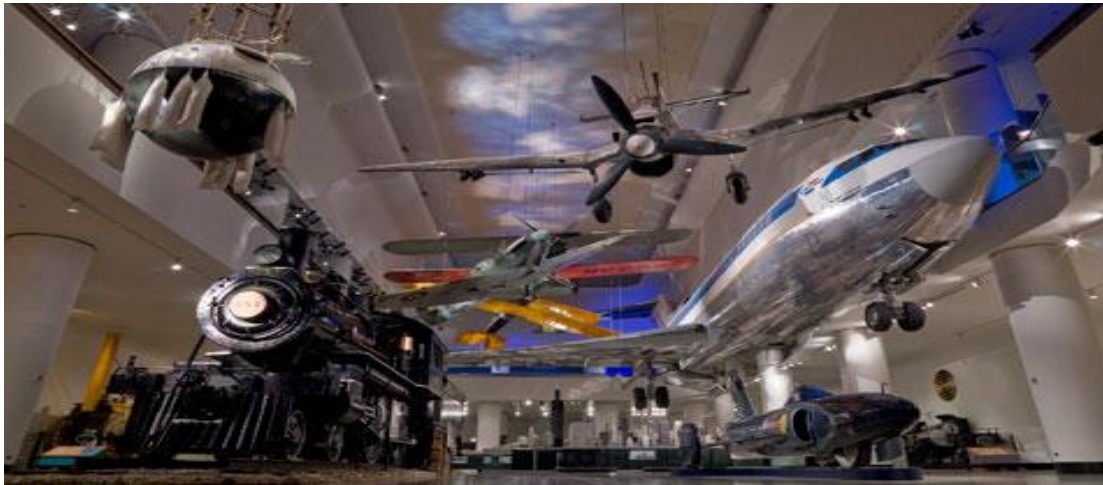
تصویر ۲۰) موزه ملی هوا فضا واشنگتن DC (۱۳۹۰)