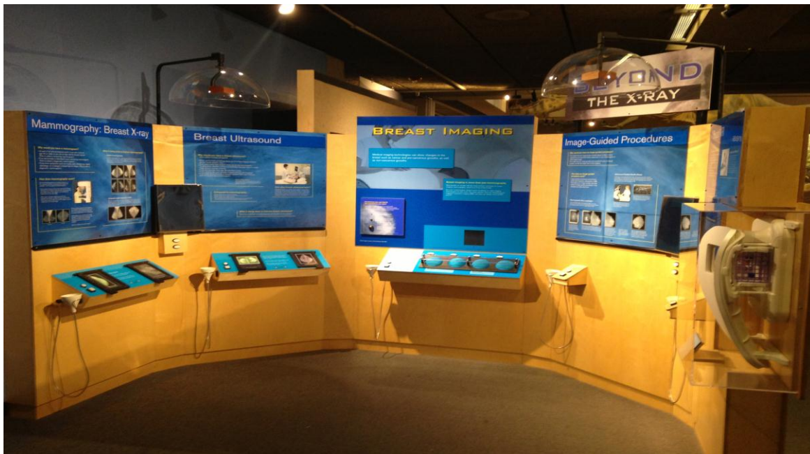
تصویر ۱۱) سالن آشنایی با تصویربرداری پزشکی (۱۳۹۳)