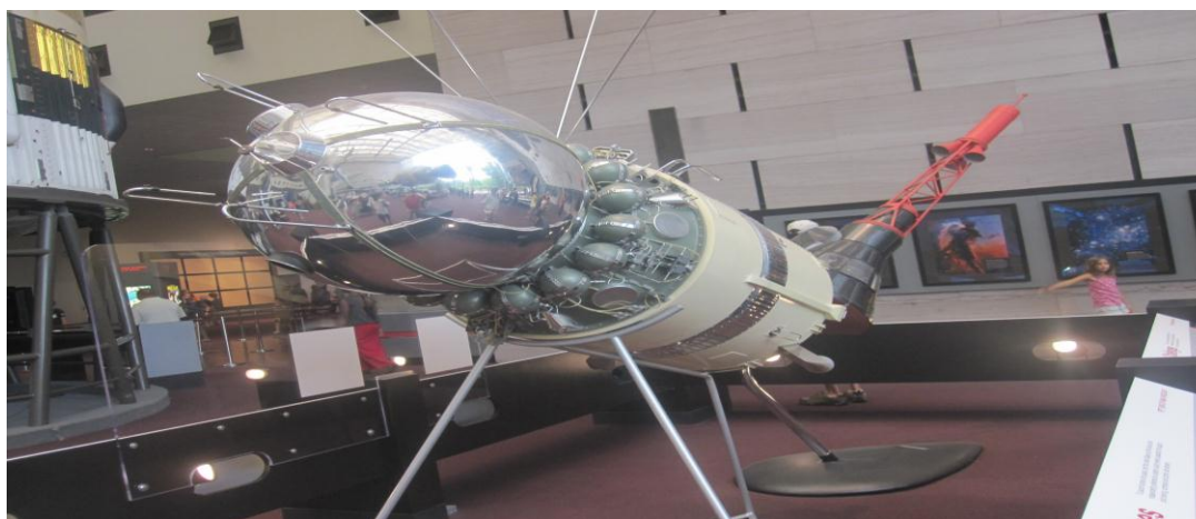
تصویر ۱۶) موزه ملی هوا فضا واشنگتن DC (۱۳۹۰)