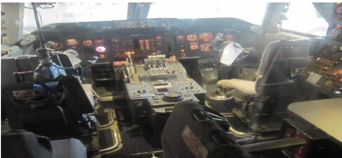
تصویر ۲۲) موزه ملی هوا فضا واشنگتن DC (۱۳۹۰)