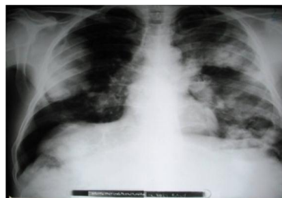
شکل ۱) رادیوگرافی اشعه ایکس ریه

یافته‌های مثبت در سابقه طبی وی یک عمل جراحی کیست هیداتید کبد در ده سال پیش بود. همچنین بیمار تدخین سیگار را متذکر بود. شرح حالی از تماس نزدیک با سگ و حیوانات خانگی را نمی‌داد. بیمار در معاینه کلی بدحال نبود. شرح حالی از کاهش وزن نداشت و علائم حیاتی وی در محدوده طبیعی بود. در معاینه، ریه‌ها در سمع نرمال بود و سایر معاینات بالینی در محدوده نرمال بودند. یک گرافی اشعه ایکس ریه انجام شد (شکل ۱).