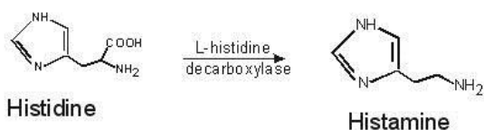
شکل ۱) دکربوکسیلاسیون هیستیدین توسط آنزیم هیستیدین دکربوکسیلاز و تولید هیستامین

هیستامین یا ۲-۴ آمینو اتیل ایمیدازول ۲ یا بتا آمینو اتیل ایمیدازول یک مولکول هیدروفیل ۳ بوده و از یک حلقه ایمیدازول و یک گروه آمین که توسط دو گروه متیلن به یکدیگر متصل شده‌اند تشکیل گردیده است و از مهم‌ترین آمین‌های بیوژنیک است. این ترکیب، به عنوان عامل ضد تغذیه‌ای طبیعی مطرح بوده و سبب بروز مسمومیت ناشی از مصرف غذا در انسان می‌شود. هیستامین از طریق واکنش آنزیمی، دکربوکسیلاسیون توسط آنزیم هیستیدین دکربوکسیلاز ( Histidine Decarboxylase ) بر روی اسید آمینه هیستیدین موجود در ماهی تولید می‌گردد (شکل ۱) (۱۰).